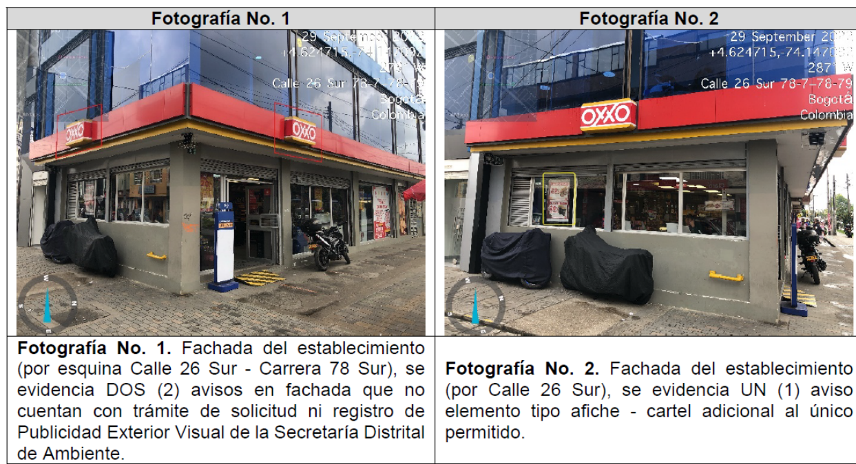
Tabla 3. Registro fotográfico

Valoración técnica y conductas generales evidenciadas (Ver Anexo No. 1. Acta de Visita No. 204753).